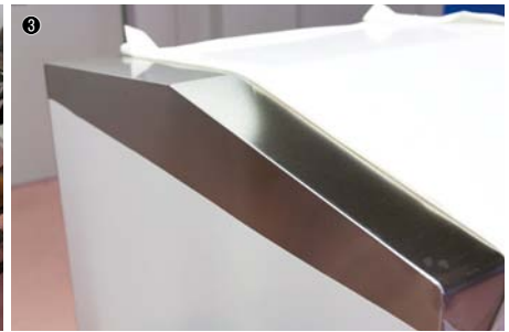
①FLWの2号機には特注のシャトルテーブルを設置。加工中に治具へのセッティングができる／②FLWで加工したサンプルワーク／③連続発振（CW発振）により歪みのない高品位溶接が可能

まほど、実績がないことが採用の障害になっています。そこでオープンファクトリーなどを通じてお客さまに提案し、引張り試験の結果などを提示することで、採用してもらえるよう働きかけています。実際、当社が提案したことで「レーザ溶接可」の図面も少しずつ増えてきています。