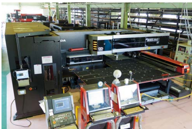
パンチ・レーザ複合マシンACIES-2512T(自動倉庫MARS・130棚と連動)を2セット導入。裏キズレス加工が受注拡大に貢献した

溶接ロボットFLW-4000M3は、お客さまから「ステンレス・アルミの溶接は岡田钣金には頼めない」と言われたことから、そうした評価を打破するために導入しました。結果として、裏キズレス加工に対応するACIESと、歪みが少なくビード面がきれいな高品位溶接に対応するFLW——この2つの設備の効果により、医療機器や食品機械などのステンレス製品の仕事量が増えました。3年前には30%程度だったステンレス材料の割合は50%程度にまで増えています。