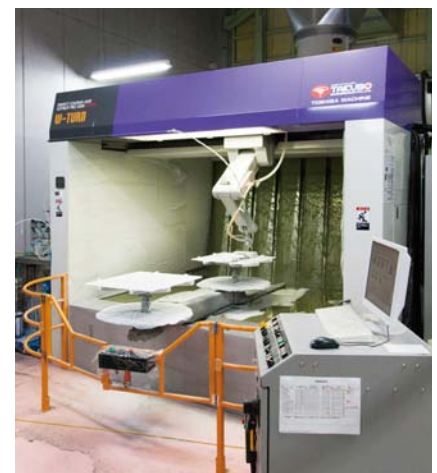
自動塗装ロボット