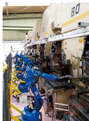
プレス工程では複数台の単発プレスを直列に並べ、プレス間のワークを搬送するロボットラインシステムを運用

もできません。また、現在はEDIを通じて受注すると生産管理システムWILLに自動登録され、納期変更も自動反映されるプログラムを追加・運用していますが、現場に流れている紙の指示書には変更が反映されませんから、毎日進捗状況を見ながら画面と紙を照合しなければなりません。ボリュームが増えてきたことで、こうした山積み・山崩し、納期変更への対応が深刻な課題になっているのですが、「V-FACTORY」で示された構想が実現すれば一挙に解決します。3次元モデルに曲げ・溶接・スタッド溶接といった加工属性を入力し、加工シミュレーションで自動算出したリードタイムが生産管理システムにフィードバックされ、参考値としてでもSTに登録される。それが生産スケジュールへと反映され、山崩しへとつなげることができれば、よりスピーディーかつ精度の高い管理ができます。多品種少量生産が高度化すればするほど、生産管理の重要性は増していきます。まだまだ道半ばだとは思いますが、「V-FACTORY」の実現には大いに期待しています。