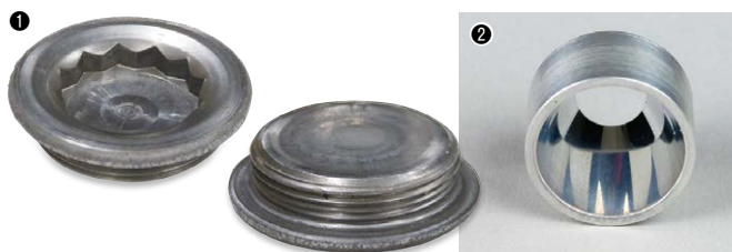
①「超精密板鍛造プレスにおける金型内ねじ転造(雄ねじ)工法一貫システム」で加工した電動パワーステアリングのラックガイドプラグ／②「第5回ものづくり日本大賞」で優秀賞を受賞した「鏡面プレス加工技術と特殊電解イオン水洗浄技術による精密三次元鏡面形成技術」で加工した3次元反射鏡(リフレクター)

定義だけでも活動しなければ意味がないので、「働き甲斐向上委員会」を設置した。委員会では、「互尊互敬」「自己実現」につながるあらゆることを協議し、社員合意のもとで、少しでも「働き甲斐」が高まるようにした。そこでは福利厚生の実施だけでなく、チャレンジや社会貢献など、きびしいことも求めている。そうしたことを社員がみずから考え、会社を変えようと思えば