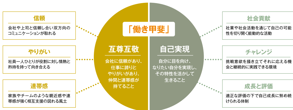
● 図2 理念①：人をつくり人をまもる働き甲斐No1企業としての成長 「働き甲斐」の定義を「互尊互敬」と「自己実現」とする

注意しなければいけないのは「 人につか、理念につか 」。「人に属して理念につかず」では、人が変わると会社も変わってしまう。たとえ人が変わっても、ひとつの目的・目標とあるべき