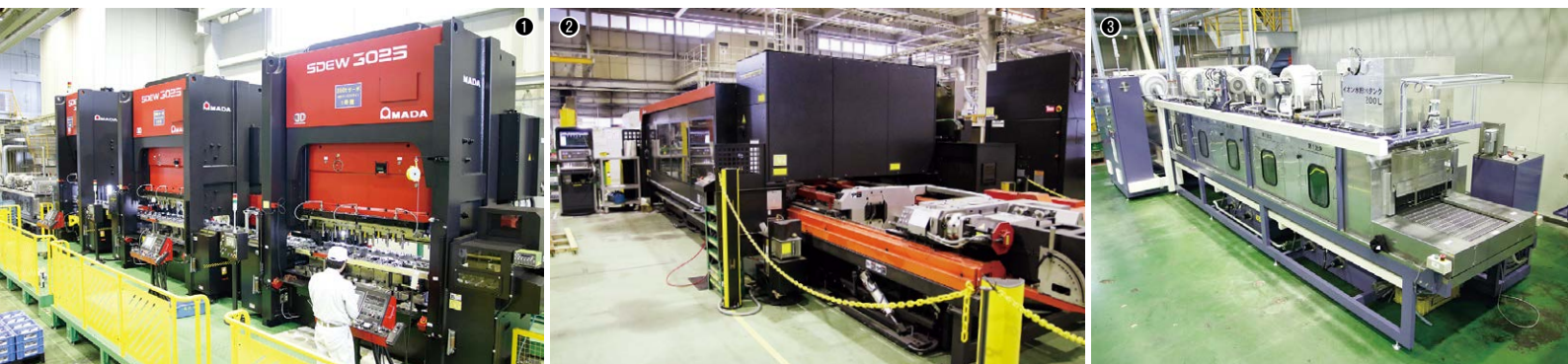
①サーボプレスSDEW-3025×2台とSDE-3030をトランスファー装置で連結したタンデムライン／②レーザーマシンFO-MII RI 3015+LST-RI 3015／③自社製品の電解イオン水洗浄装置