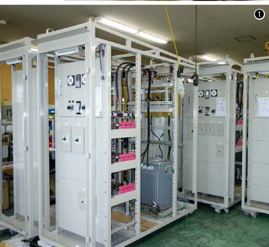
①組立・配線中のキュービクル／②EMK-3612MIIによるブランク加工