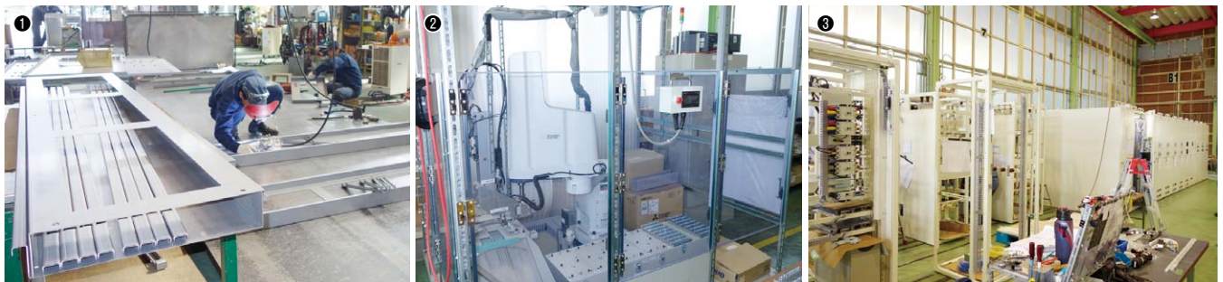
① 筐体のトビラや側板の溶接作業 / ② ボルトやネジを締め付けていく作業にロボットを採用。供給装置を組み込むことで自動化を実現している / ③ キュービクルの電装組込み作業

同社の得意先は官公庁、学校、病院、発電所などが多く、安定感がある。2016年後半から繁忙感が増し、今年度中は高い受注状況が続くとみられており、営業活動にいっそう力を入れていく方針だ。四国を代表する配電盤システムメーカーとして、これからの発展が期待される。