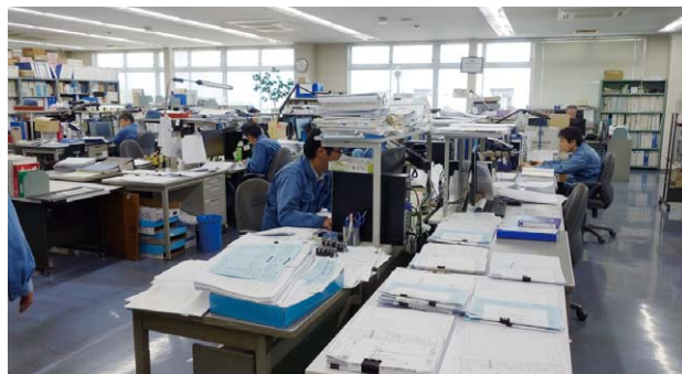
設計プログラム室

「しかし、塗装前の脱脂、排水処理、塗装作業の雰囲気——環境管理、安全衛生など課題も多く、新規に塗装工場を