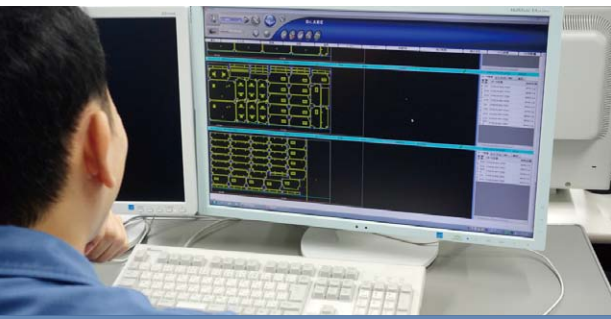
ブランク加工データ作成全自動CAM Dr.ABE_BlankによるEMKのネスティング作業

「IoTを活用したモノづくりが話題となっていますが、大事なことは目的をはっきりさせること。工程ボードを活用した情報の“見える化”も、現在の運用が定着するまでには、何度も繰り返し変