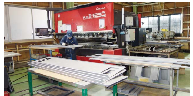
FBD III-1253 NTによる曲げ加工