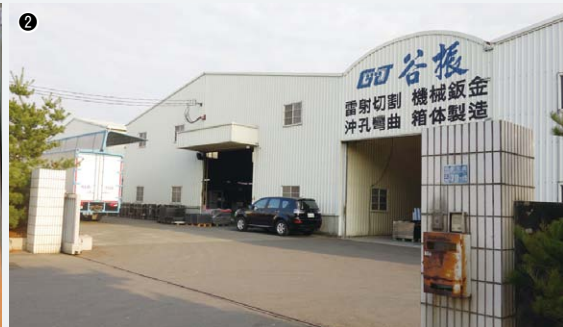
①陳忠垣總經理(中央)と長男の陳俊宏さん(右)と次男の楊詠荃さん(左) / ②台湾・谷振股份有限公司の本社工場

営学を学び、帰国後2年間は同社で営業職に携わった。その後は1年半、日本へ留学した。