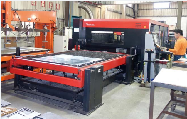
平板・パイプ・形鋼に対応するレーザマシンFO-MII RI 3015NT+LST-RI 3015