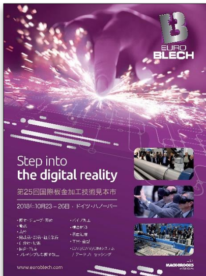
世界最大の板金加工技術展 「EuroBLECH」の開催告知 (Mack Brooks Exhibitions Ltd.)