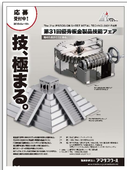
「優秀板金製品技能フェア」の 募集告知 (職業訓練法人アマダスクール)