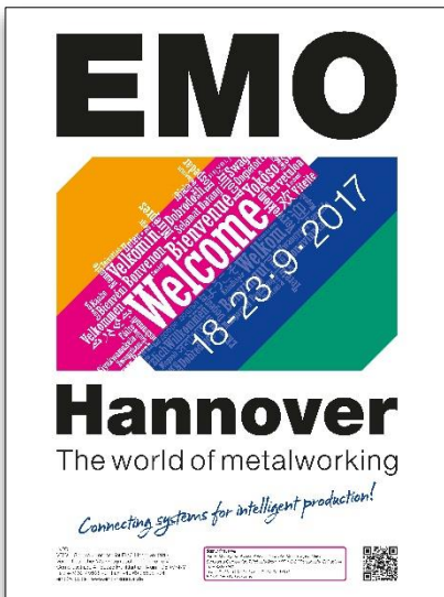
欧州最大の工作機械見本市 「EMO」の開催告知 (Deutsche Messe AG)